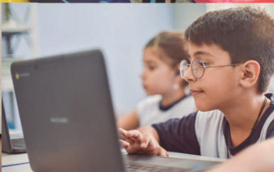
技术是儿童学习的一部分

容迪亚伊是儿童友好型城市，加入拉丁美洲拉丁美洲儿童友好型城市网络，最近受伯纳德·凡·利尔基金会邀请加入“95厘米城市”计划，该计划专注于 0 至 6 岁阶段所发展的行动。2022 年 10 月，市政府批准了以跨部门方式制定并有儿童参与的 PMPI（市政幼儿计划），为未来十年的幼儿教育行动投资制定了指导方针。