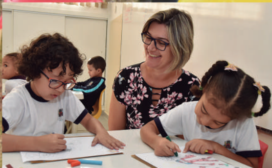
四岁起的英语课程