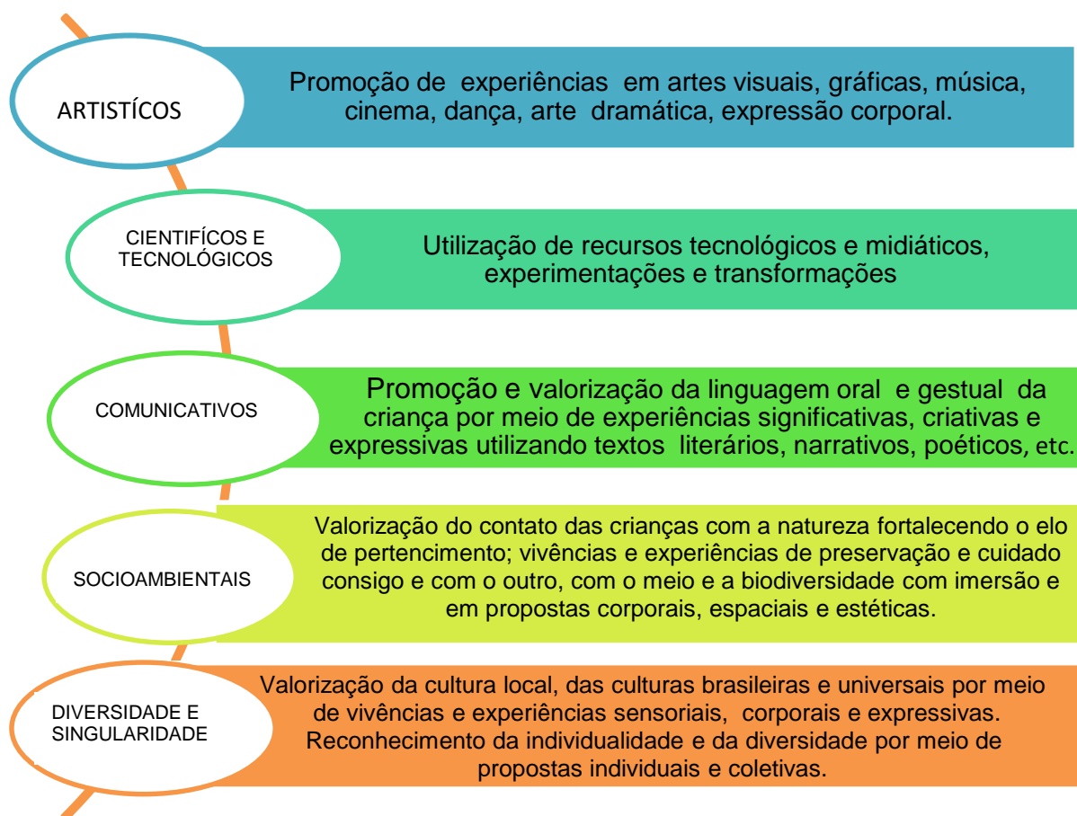
fig 2 - Saberes essenciais - Populares e eruditos

S A B E R E S P O P U L A R E S E R U D I T O S