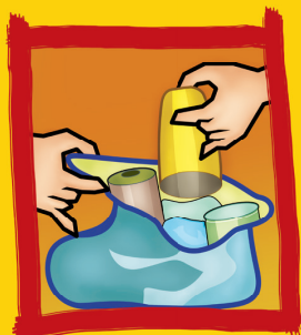
Embale bem no lixo todo objeto que possa acumular água.