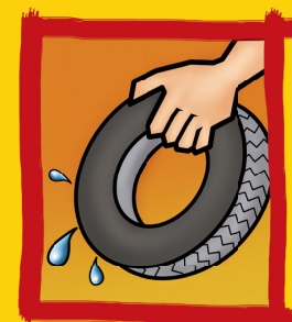
Entregue pneus velhos ao serviço de limpeza urbana ou mantenha-os em local seco, abrigado da chuva.