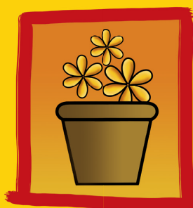
Retire os pratos dos vasos das plantas ou vire-os de cabeça para baixo.