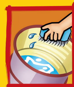
Lave com escova e sabão os tanques utilizados para armazenar água frequentemente.