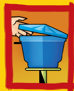
Mantenha a caixa d'água sempre muito bem tampada.