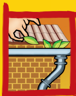
Mantenha as calhas sempre limpas e desobstruídas.