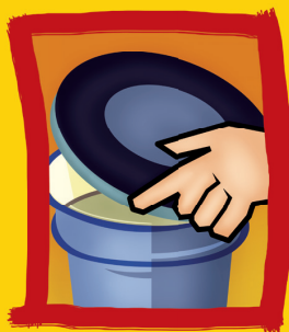
Mantenha tonéis e barris sempre muito bem tampados.