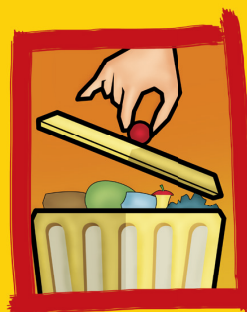
Armazene o lixo adequadamente e mantenha a lixeira bem fechada.