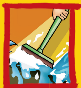
Não deixe a água da chuva acumular sobre a laje.