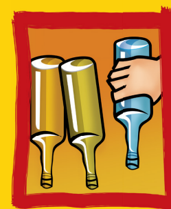
Guarde garrafas sempre de cabeça para baixo.