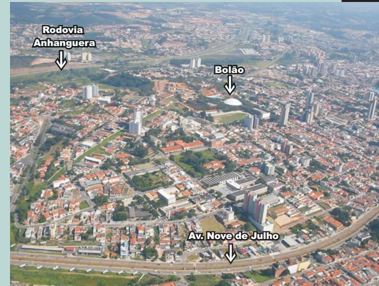
Vista parcial do Bairro do Anhangabau. Abaixo, a Av. Nove de Julho; acima, ao centro, o Ginásio de Esportes Dr. Nicolino de Lucca (Bolão) e, acima, a Rodovia Anhanguera.