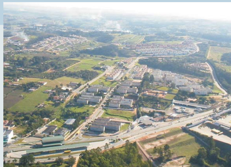
Vista parcial do Bairro CECAP

A sigla "CECAP" quer dizer "Caixa Estadual de Casas para o Povo" e se refere ao financiamento então aberto para a aquisição da moradia.