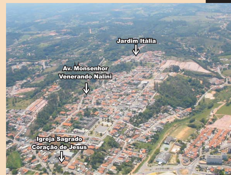
Vista parcial do Bairro da Colônia. Abaixo, à esquerda, a Igreja Sagrado Coração de Jesus e, ao centro, Av. Monsenhor Venerando Nalini.