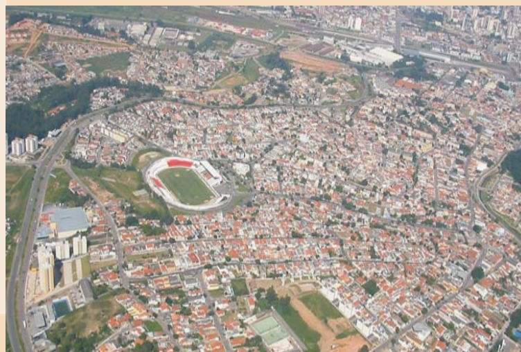
Vista parcial do Bairro do Jardim Pacaembú