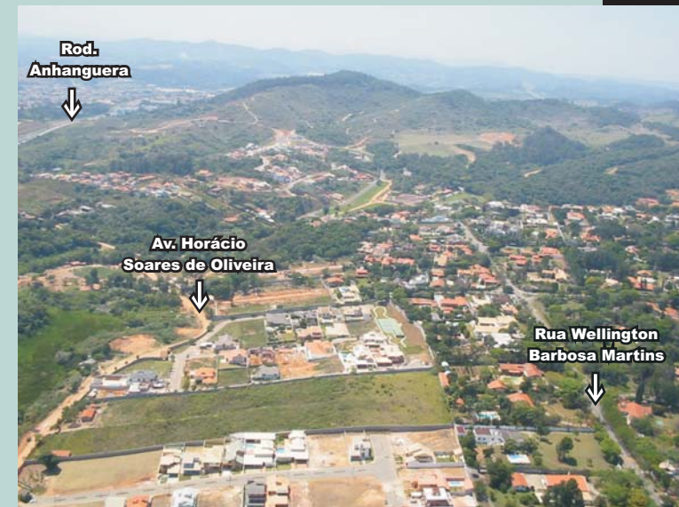
Vista parcial do Bairro da Malota. À direita, Rua Wellington Barbosa Martins; à esquerda, Av. Horácio Soares de Oliveira e, acima, vista parcial da Serra do Japi.