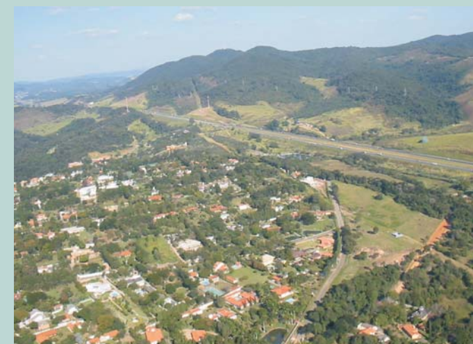
Vista parcial do Bairro da Malota