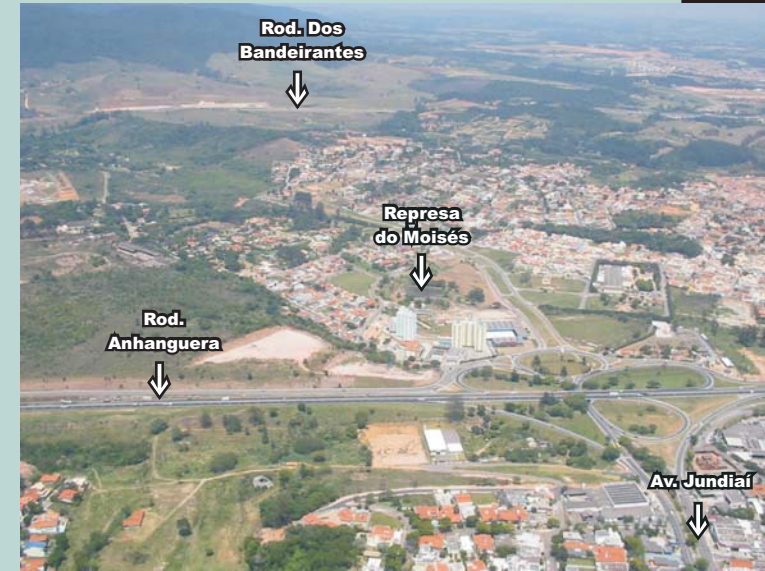
Vista parcial do Bairro do Moisés. Abaixo, a Rod. Anhanguera; ao centro, Represa do Moisés e, acima, Rodovia dos Bandeirantes.