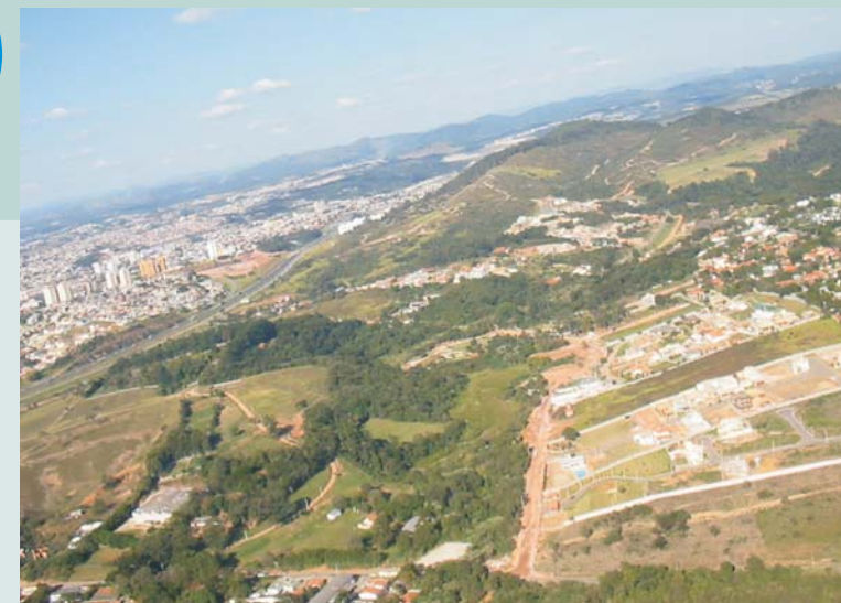
Vista parcial do Bairro Moisés