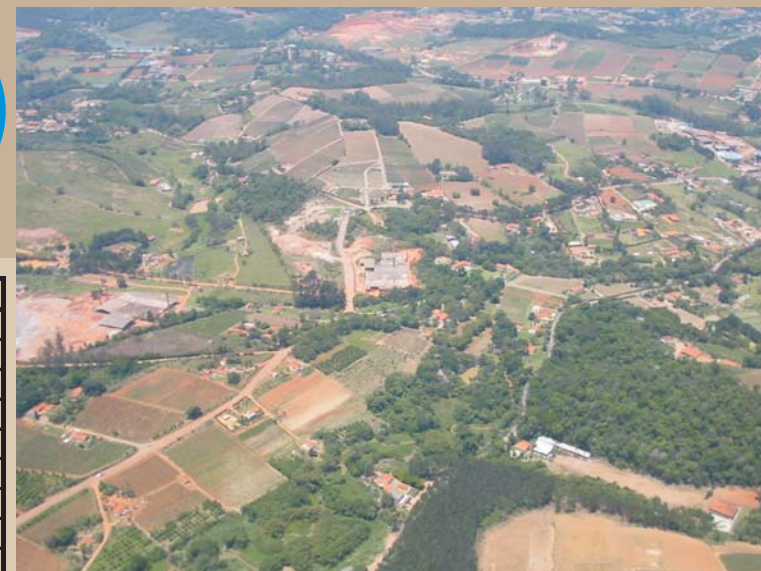
Vista parcial do Bairro Nova Odessa