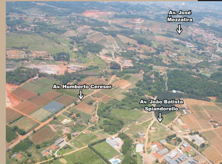
Vista parcial do Bairro Nova Odessa. Ao centro, Av. Humberto Cereser; abaixo, à direita, Av. João Batista Spiandorello e acima, Av. José Mezzalira.