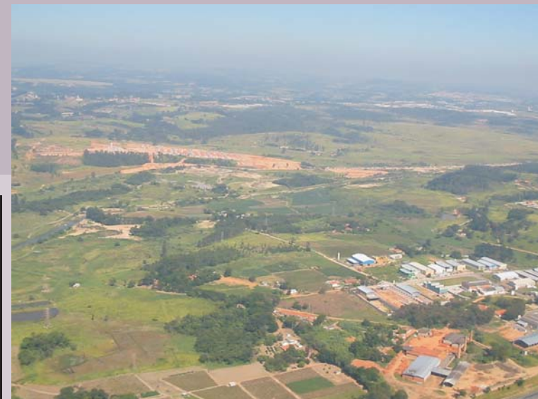
Vista parcial do Setor Industrial