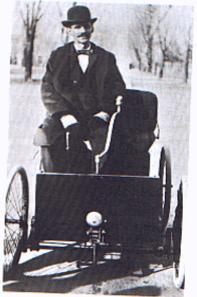
Henry Ford em seu primeiro automóvel (1896)

ESTEIRA DE PRODUÇÃO - ELIMINA A MOVIMENTAÇÃO ATIVA DO TRABALHADOR RITMO DITADO PELA MÁQUINA, SUPER ESPECIALIZAÇÃO DO TRABALHADOR NAQUELA TAREFA.